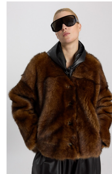
52381 JENYNE • Toscana • Hand Painted Sable • 1.075€ • Lacon Teddy • 1.155€ • L Merino Straight Hair 0,4-0,5 mm • 910€