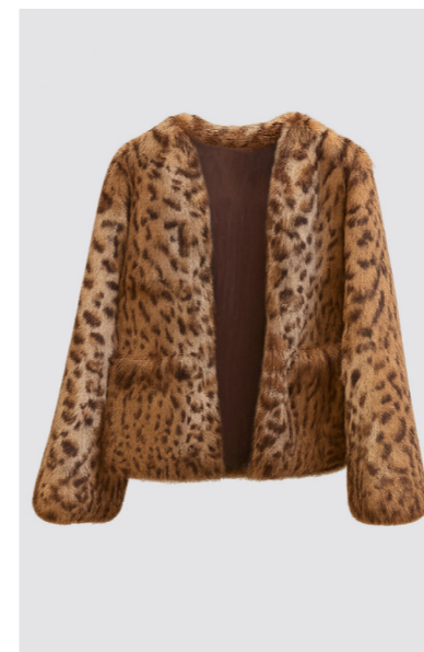
7209 MADDIE • Rabbit • Printed Ozelot • 475€