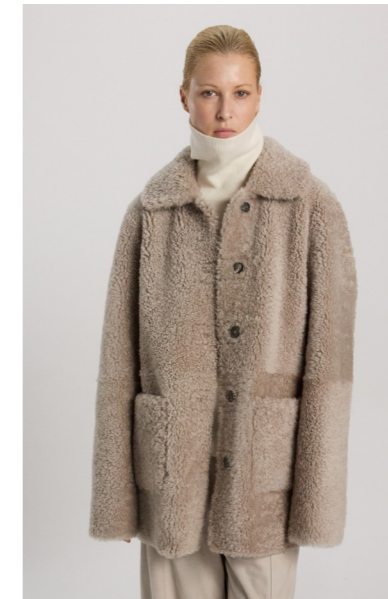
52411 JISEI • Karakul • Light Grey • 1.100€ • L Merino Straight Hair 0,4-0,5 mm • 1.020€