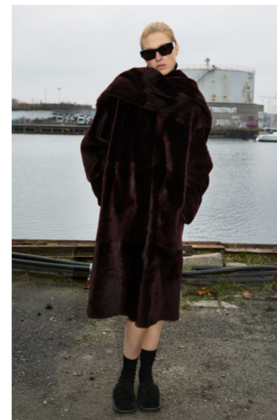
51261 CHIYO • Lacon Seta • Red Wine • 1.910€ • without scarf • 1.605€ • L Merino Straight Hair 0,4-0,5 mm • 1.395€