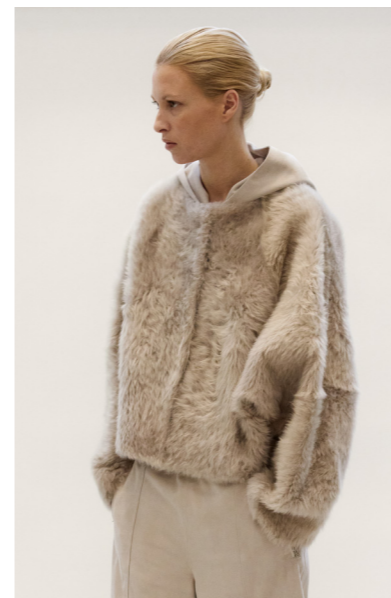
52407 JUKA • Body: Lacon Teddy / Hoody: Lux suede • Light Grey • 1.555€ • without hood • 1.355€