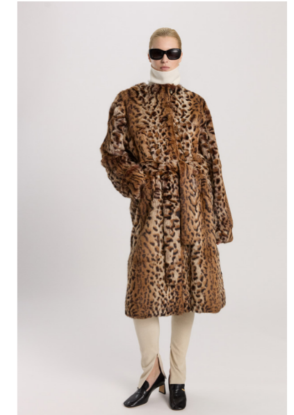
7207 CHIKARA • Rabbit • Printed Ozelot • 685€