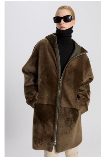
52366 JOLI • L Merino Straight Hair 0,4-0,5 mm • Army • 1.060€ • Lacon Teddy • 1.510€