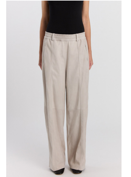
13573 PINA • Lux Suede • Light Grey • 805€ • Metis Suede 0,5 mm • 710€ • Lamb Nappa Dragon 0,3-0,4 mm • 625€