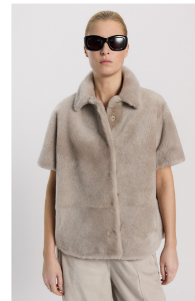
52400 SAKI • Lacon Seta • Light Grey • 925€ • L Merino Straight Hair 0,4-0,5 mm • 675€