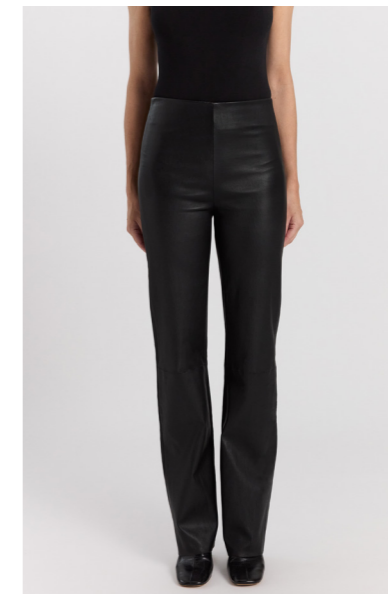
13544 PRINCE • Ela Lamb • Black • 495€