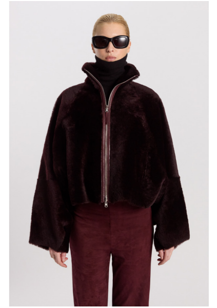
52338 JACKSON • Lacon Seta • Red Wine • 1.270€ • L Merino Straight Hair 0,4-0,5 mm • 890€