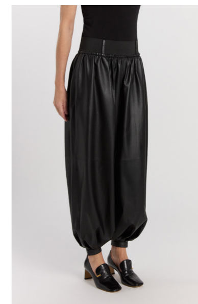
13575 PURI • Lamb Nappa Dragon 0,3-0,4 mm • 710€ • Metis Suede 0,5 mm • 775€