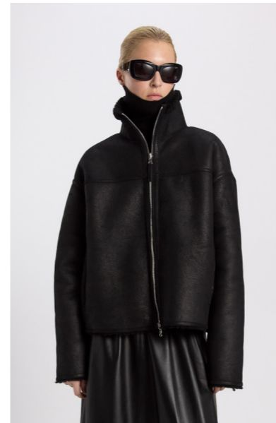
52419 JUPIN • Merino Curly • Vintage Black • 950€ • Lacon Teddy • 1.190€ • L Merino Straight Hair 0,4-0,5 mm • 925€