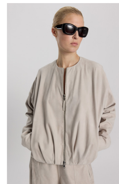
12588 JAIKO • Lux Suede • Light Grey • 765€ • Metis Suede 0,5 mm • 690€ • Lamb Nappa Dragon 0,3-0,4 mm • 620€