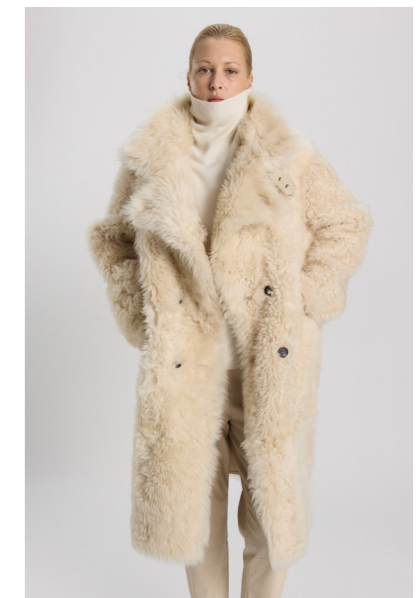
52417 JUHA • Etnic Curly • Antique White • 1.560€ • Etnic Curly Black • 1.330€