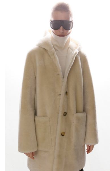
52410 JOUKO • Africa Mouton • Antique White • 920€