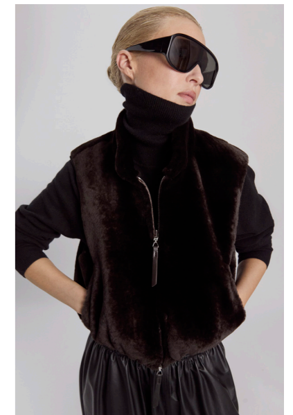
5676 VICENTA • Africa Mouton • Delicioso • 475€