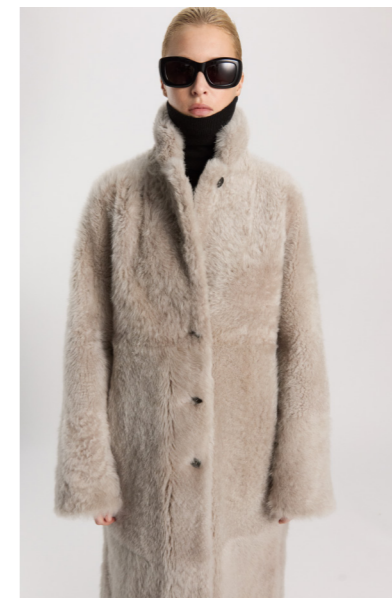
52408 JUNNA • Lacon Teddy • Light Grey • 1.555€ • L Merino Straight Hair 0,4-0,5 mm • 1.090€