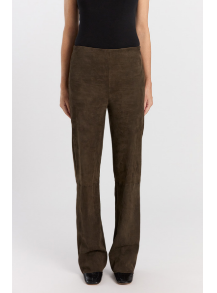
13544 PRINCE • Ela Suede • Army • 450€