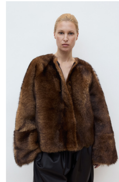
52420 JIO • Toscana • Hand Painted Sable • 1.915€ • L Merino Straight Hair 0,4-0,5 mm • 920€