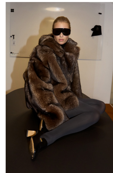
52349 JALO • Toscana Fokina • Hand Painted Coyote • 1.430€ • L Merino Straight Hair 0,4-0,5 mm • 930€