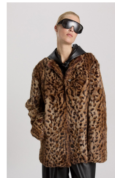
7211 JANA • Rabbit • Printed Ozelot • 585€