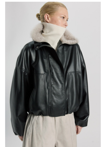
12574-A JADE • Lamb Nappa Dragon 0,5 - 0,6mm/Lacon Teddy • Black/Light Grey • 765€