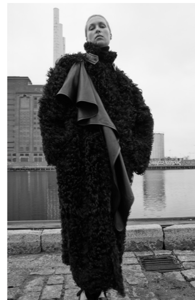
51267 CLOVER • Etnic Curly/Lamb Dragon • Black • 1.680€ • 51267-A • w/o scarf • Etnic Curly • Antique White • 1845€