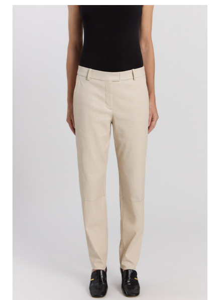
13576 PIA • Ela Lamb • Salt • 565€