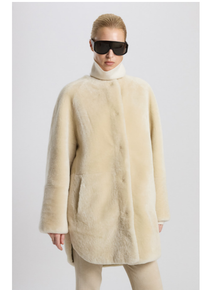
52412 JURINA • Africa Mouton • Antique White • 815€