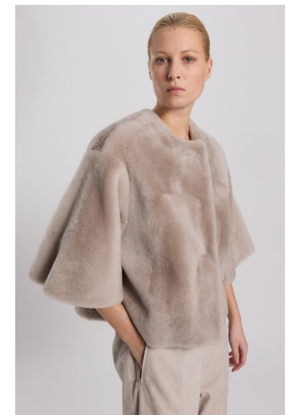
52365 JEWELLE • Lacon Seta • Light Grey • 1.105€ • L Merino Straight Hair 0,4-0,5 mm • 845€