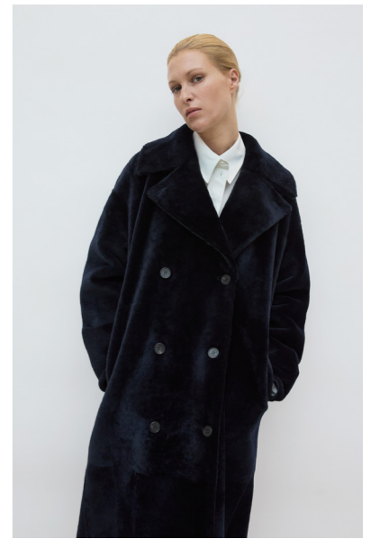
51241 CLARK • L Merino Straight Hair 0,4-0,5 mm • Midnight Blue • 1.360€ • Lacon Teddy • 1.960€