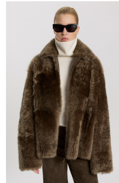
52403 JOJI • Lacon Teddy • Army • 1.280€ • L Merino Straight Hair 0,4-0,5 mm • 920€