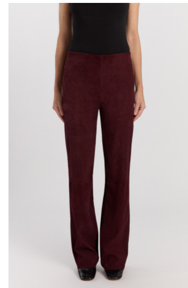
13544 PRINCE • Ela Suede • Red Wine • 450€