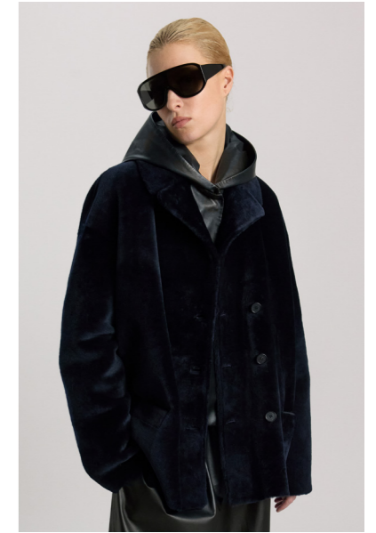
52391 JEHANNE • L Merino Straight Hair 0,4-0,5 mm • Midnight Blue • 1.045€ • Toscana Straight Hair Brisa • 1.445€