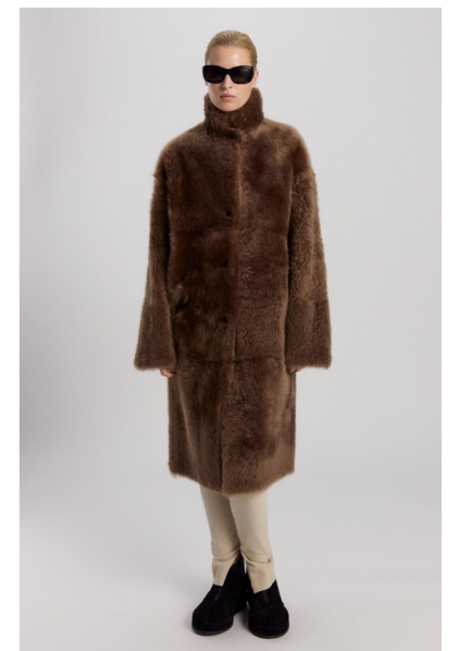
51262 CHIBA • Lacon Teddy • Mogano/ Saddle Brown • 1.630€ • L Merino Straight Hair 0,4-0,5 mm • 1.140€