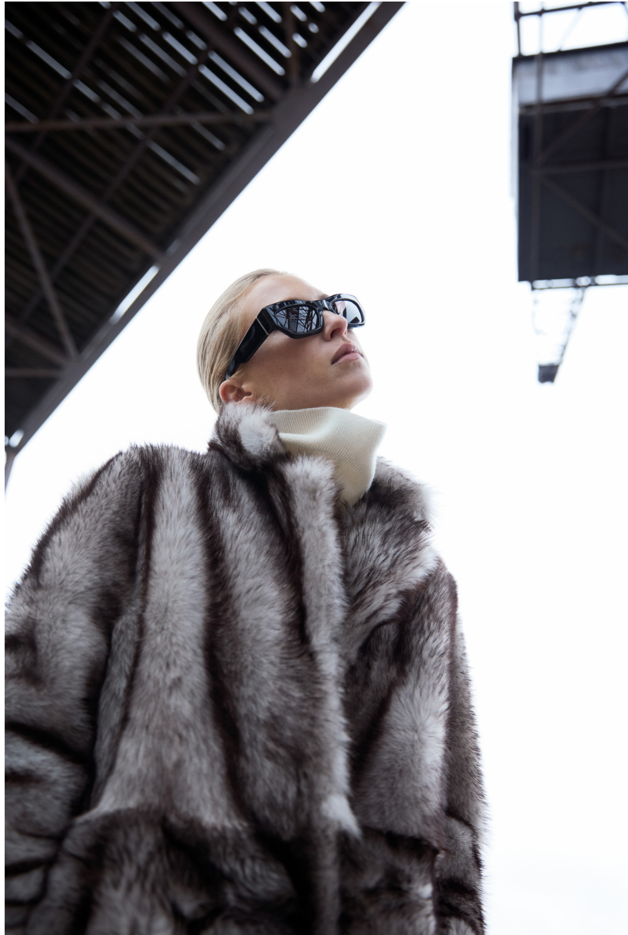
51269 CRYSTAL • Toscana • Hand Painted Siberian Wolf • 1.595€ • L Merino Straight Hair 0,4-0,5 mm • 1.175€