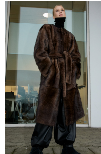
51264 CHIKARA • Toscana • Hand Painted Mink • 1.545€ • L Merino Straight Hair 0,4-0,5 mm • 1.225€