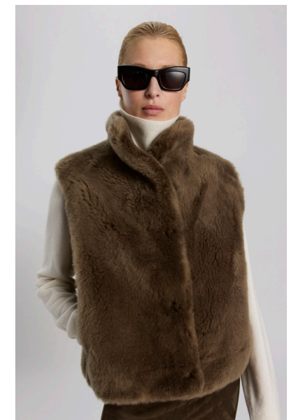
5655 VICTOR • Lacon Cashmere • Army • 815€ • L Merino Straight Hair • 645€