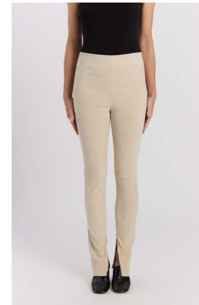
13541 LUKE • Ela Suede • Salt • 425€ • Ela Lamb • 425€