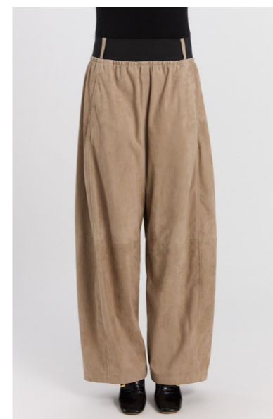
13574 PEKO • Metis Suede 0,5 mm • 735€ • Lamb Nappa Dragon 0,3-0,4 mm • 635€