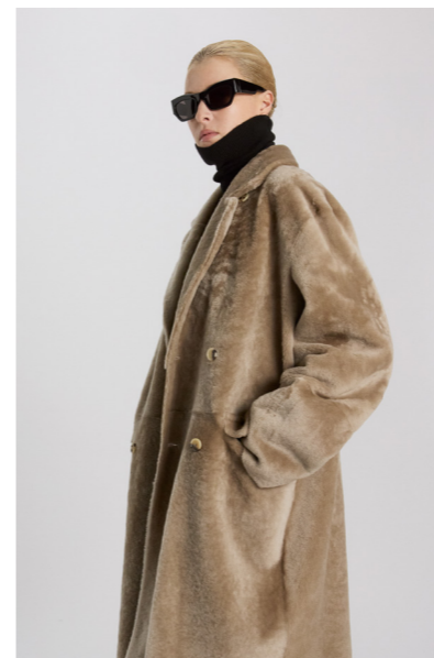
51260 CHIKA • L Merino Straight Hair 0,4-0,5 mm • Classic Beige • 1.355€