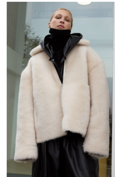
52389 JACQUI • Lacon Cashmere • Antique White • 1.375€ • L Merino Straight Hair 0,4-0,5 mm • 1.005€