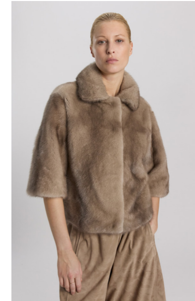
7205 JIYO • Female Mink • Silverblue • 2.735€