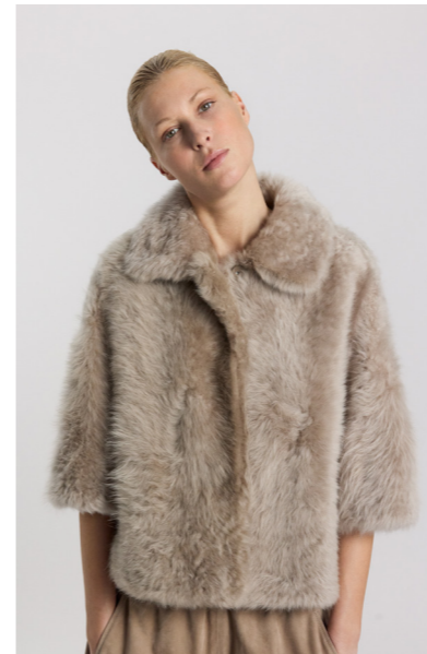
52402 JIYO • Lacon Teddy • Silver Mink • 1.065€ • L Merino Straight Hair 0,4-0,5 mm • 750€