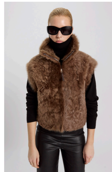
5673 VENTO • Lacon Teddy • Mogano/Saddle Brown • 740€ • L Merino Straight Hair • 585€