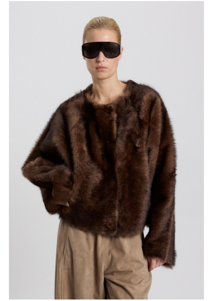
52407 JUKA • Toscana • Hand Painted Minki • 1.310€ without hood • Toscana Hand Painted • 1.215€