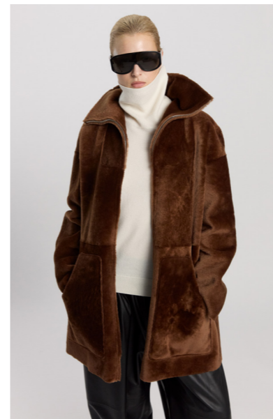
52405 JUMA • L Merino Straight Hair 0,4-0,5 mm • Nut • 1.185€ • Lacon Teddy • 1.625€