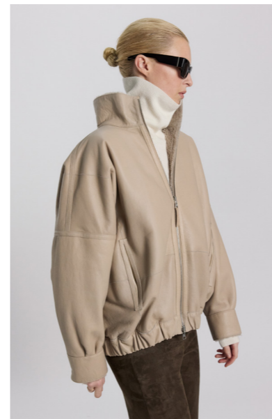
52423 JOACHINA • Lacon Chemise • Silver Mink • 1.420€