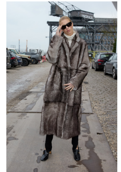
51266 CALINA • Toscana • Hand Painted Siberian Wolf • 1.595€ L • Merino Straight Hair 0,4-0,5 mm • 1.175€