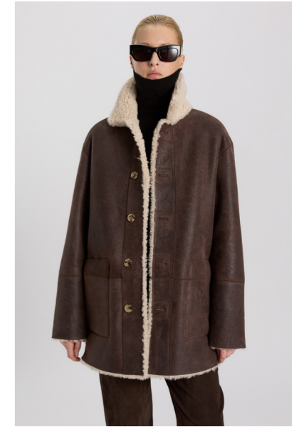
52414 JUNMI • Icelandic Merino • Mogano/Antique White • 1.075€ • L Merino Straight Hair 0,4-0,5 mm • 980€