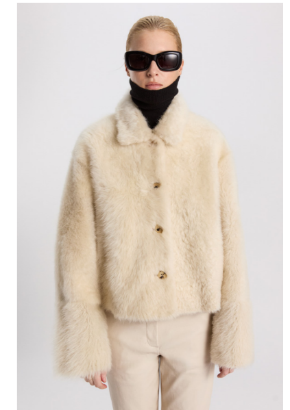
52383 JULEE • Lacon Teddy • Classic Beige/Antique White • 1.120€ • L Merino Straight Hair 0,4-0,5 mm • 825€