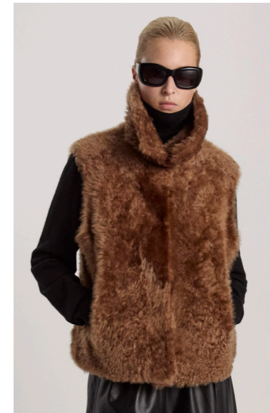
5671 VANA • Lacon Teddy • Nut • 940€ • L Merino Straight Hair • 695€