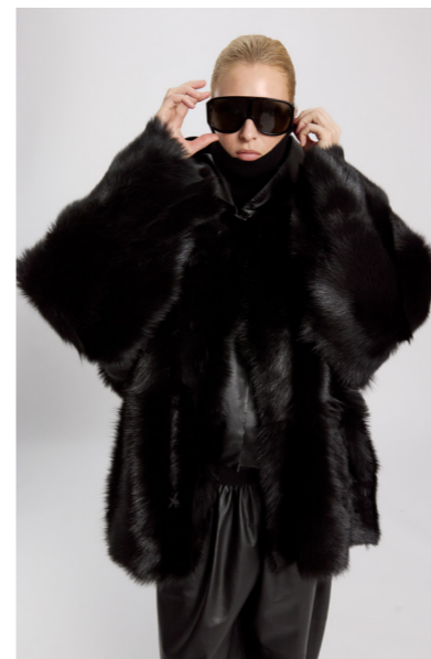
52345 JENS • Toscana L • Black • 1.120€ • Toscana Straight Hair Brisa • 1.645€ • Toscana Hand Painted • 1.515€