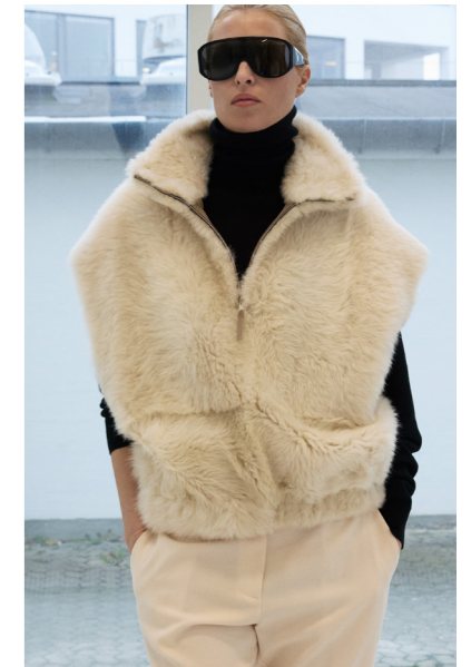
5672 VEI • Lacon Teddy 0,8-0,10mm • Classic Beige • 910€ • L Merino Straight Hair • 680€