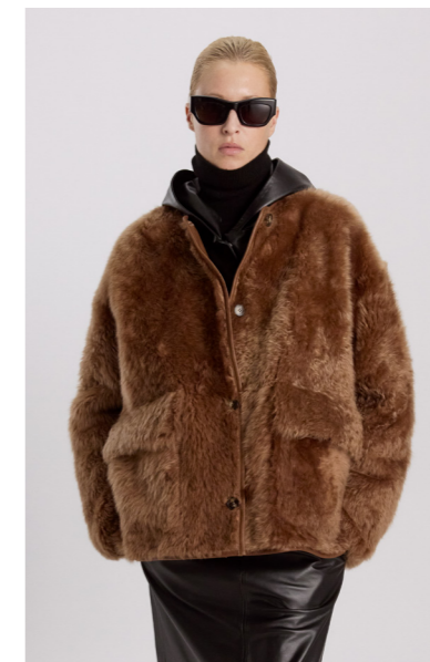
52416 JURO • Lacon Teddy • Nut • 1.335€ • L Merino Straight Hair 0,4-0,5 mm • 920€