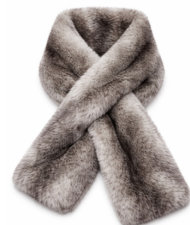
213 ANE • Toscana • Hand Painted Siberian Wolf • 415€