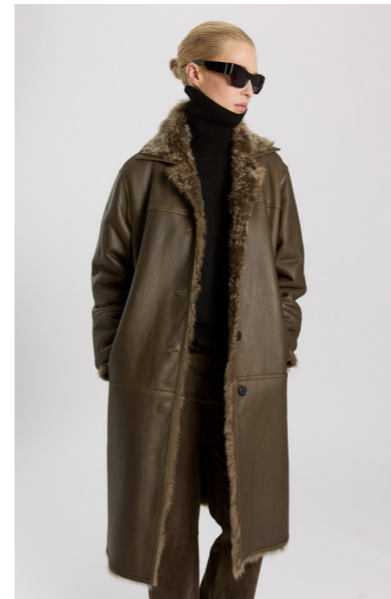
51263 CHOJI • Lacon Teddy • Army • 1.765€ • L Merino Straight Hair 0,4-0,5 mm • 1.130€