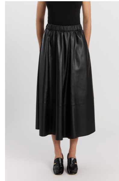
14435 NORA • Lamb Nappa Dragon 0,3-0,4 mm • Black • 605€