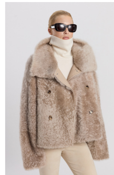
52415 JUNAE • Lacon Teddy • Silver Mink • 1.515€ • L Merino Straight Hair 0,4-0,5 mm • 980€