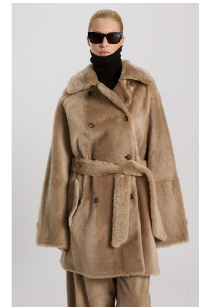
52413 JUMIKO • Lacon Seta • Classic Beige • 1.950€ • L Merino Straight Hair 0,4-0,5 mm • 1.435€