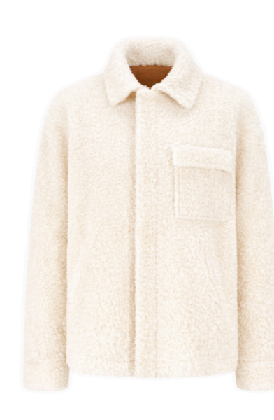
52427 SACHI • Albany • Camel/Beiges, • 1.065€ • L Merino Straight Hair 0,4-0,5 mm • 1.065€