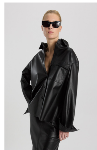
12579 SONJA • Lamb Nappa Dragon 0,3-0,4 mm • Black • 620€