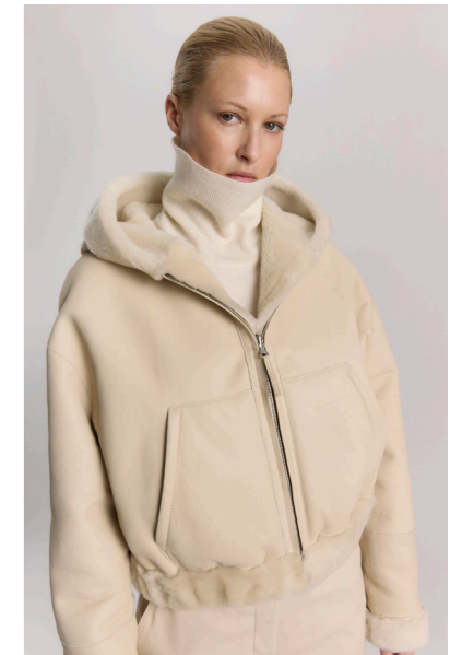
52404 JUHO • Lacon Seta • Antique White • 1.215€ • L Merino Straight Hair 0,4-0,5 mm • 910€