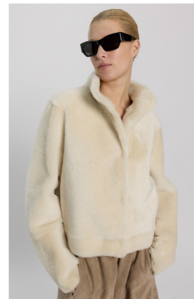
52397 JOURNI • Lacon Seta • Antique White • 1.065€ • L Merino Straight Hair 0,4-0,5 mm • 835€