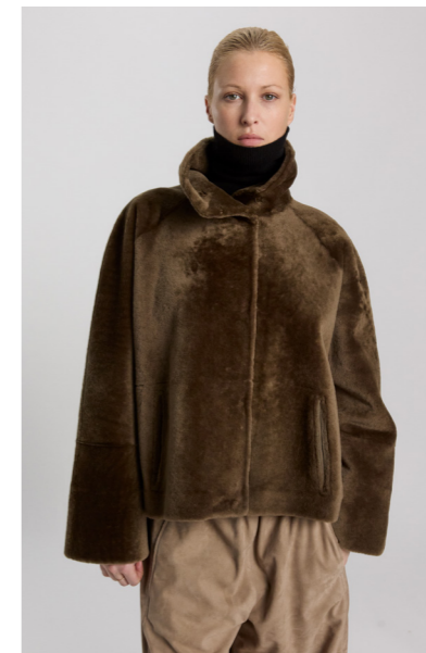
52232 JAYDA • L Merino Straight Hair 0,4-0,5 mm • Army • 960€ • Lacon Teddy • 1.340€ • Lacon cashmere • 1.270€