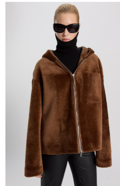
52386 JENAT • L Merino Straight Hair 0,4-0,5 mm • Nut • 1.005€ • Lacon Cashmere • 1.330€