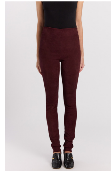
13541 LUKE • Ela Suede • Red Wine • 425€ • Ela Lamb • 425€