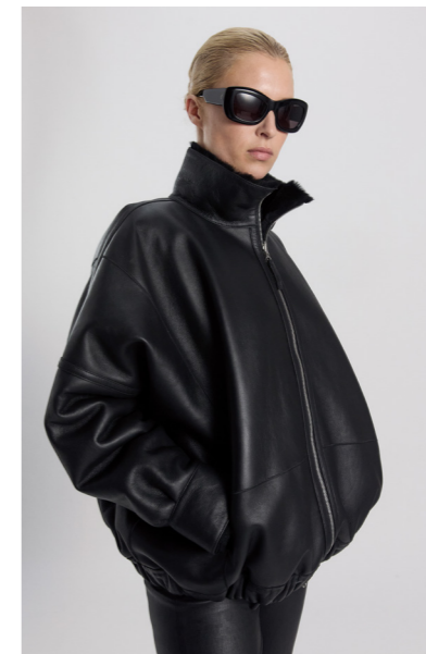
52423 JOACHINA • Merino Silky • Black • 970€ • L Merino Straight Hair 0,4-0,5 mm • 1.075€