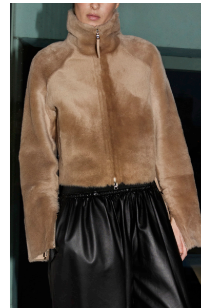
52406 JURA • Lacon Seta • Classic Beige • 1.045€ • L Merino Straight Hair 0,4-0,5 mm • 795€