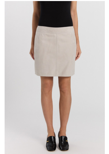
14436 NAJA • Lux Suede • Light Grey • 470€ • Metis Suede 0,5 mm • 420€