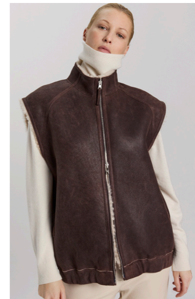
5674 VIKO • Icelandic Merino • Mogano/Antique White • 755€ • L Merino Straight Hair • 735€