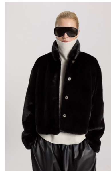
7204 JULEE • Female Mink • Black • 2.490€