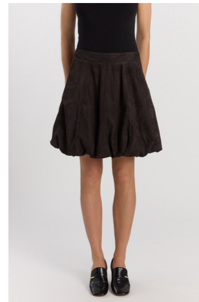
14439 NIKO • Metis Suede 0,5mm • Delicioso • 520€