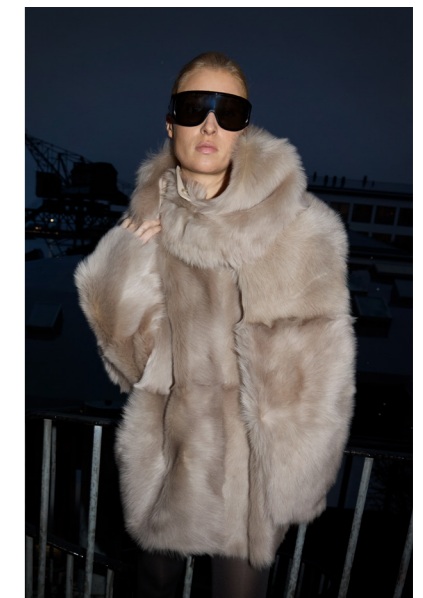
52401 JINKO • Spanish Toscana • Silver Mink • 1.740€ • Ethnic Curly Black • 1.520€