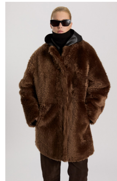
52412 JURINA • Merino Teddy • Mogano/Saddle Brown • 1.095€ • L Merino Straight Hair 0,4-0,5 mm • 970€