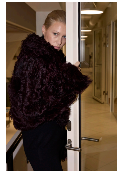
52409 JIRA • Ethnic Curly • Red Wine • 1.170€ • Ethnic Curly Black • 1.005€ • L Merino Straight Hair 0,4-0,5 mm • 835€