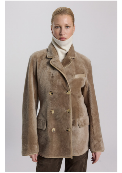
52424 JONI • L Merino Straight Hair 0,4-0,5 mm • Classic Beige • 1.120€