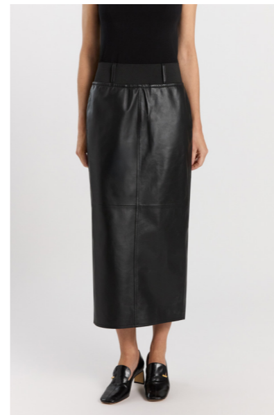
14438 NARA • Lamb Nappa Dragon 0,5 - 0,6mm • Black • 530€